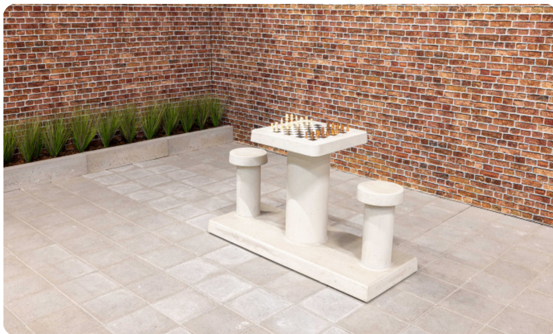
Table d'échecs en béton naturel 2 personnes