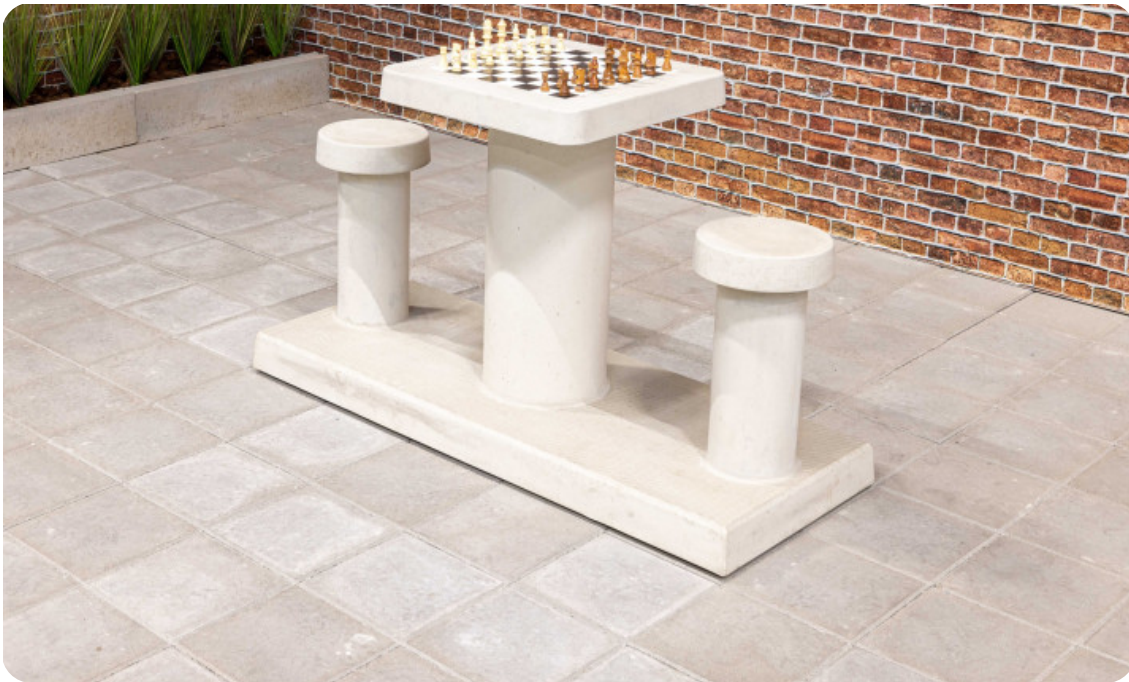
Table d'échecs en béton naturel 2 personnes