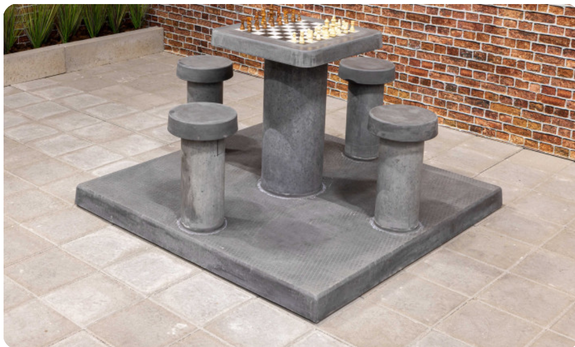
Table d'échecs en béton anthracite, 4 personnes