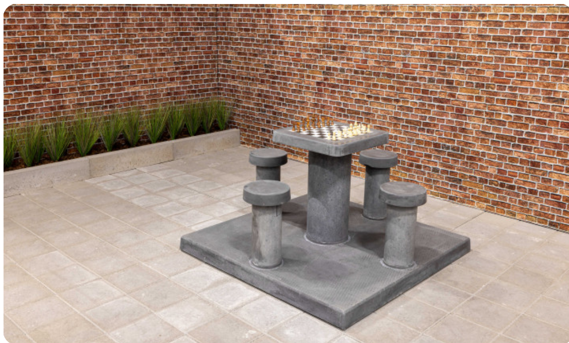
Table d'échecs en béton anthracite, 4 personnes