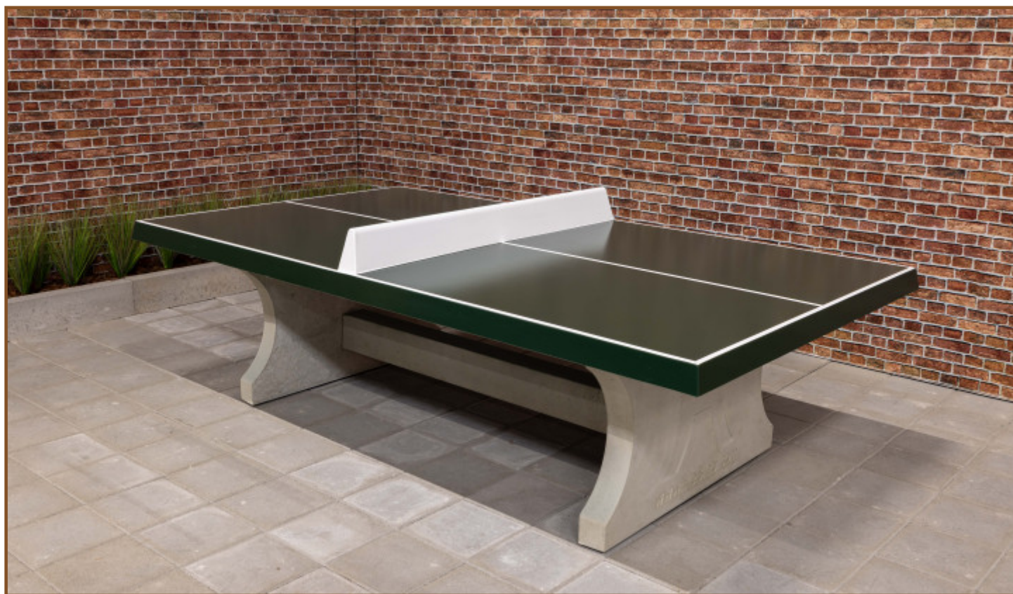
Table de ping-pong verte