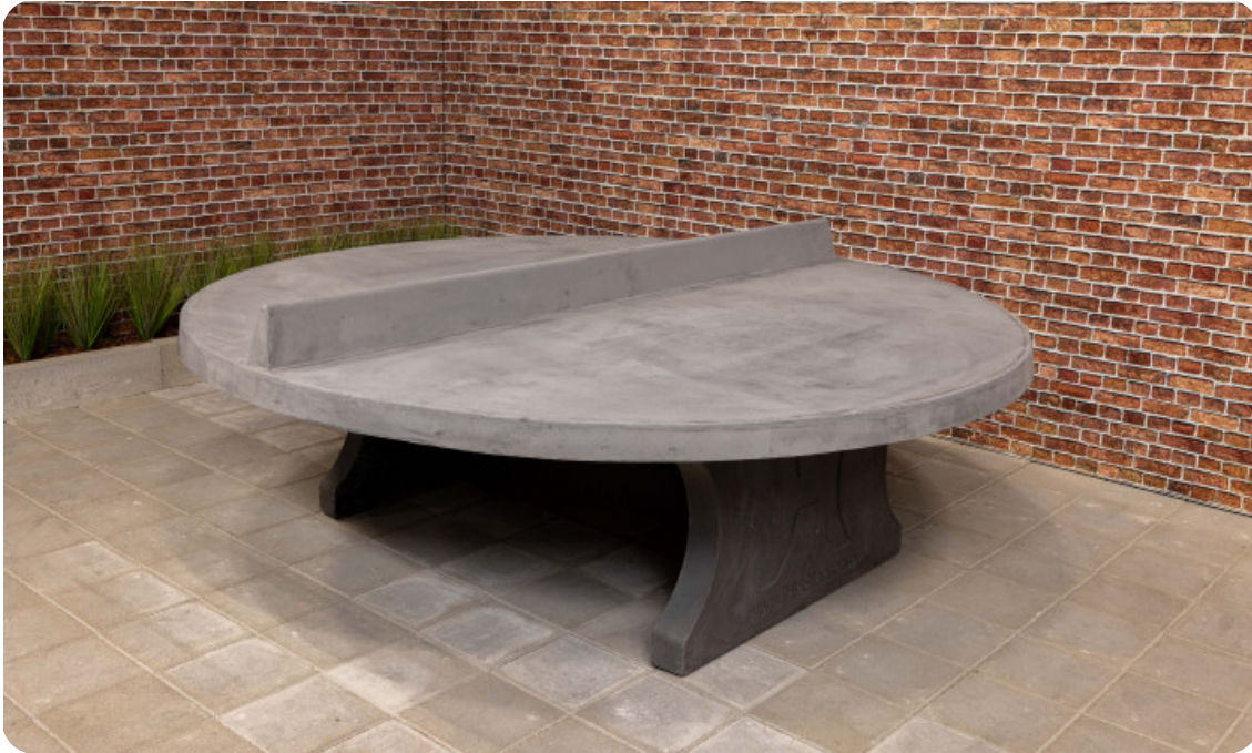
Table de ping-pong béton-anthracite ronde